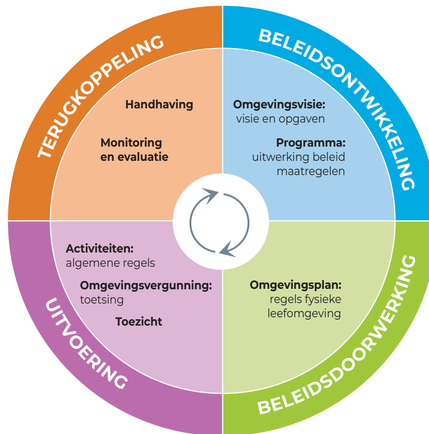
Figuur 2 – Beleidscyclus van de Omgevingswet

De beleidscyclus start met de kaders en ambities in een Omgevingsvisie. Deze vertalen we in programma's en in het Omgevingsplan en uiteindelijk in de vergunningverlening. Door tussentijds te monitoren, te evalueren en dan onze keuzes bij te stellen, ontstaat een beleidscyclus. Als het nodig is, zullen we de Omgevingsvisie aanpassen aan dan actuele vragen. Als richtlijn houden we hierbij de raadsperiode aan. De eerste evaluatie zal daarmee in 2027 plaatsvinden. Mocht er aanleiding bestaan voor tussentijdse aanpassingen, dan legt het college dit op het moment dat dit actueel is voor aan de raad.